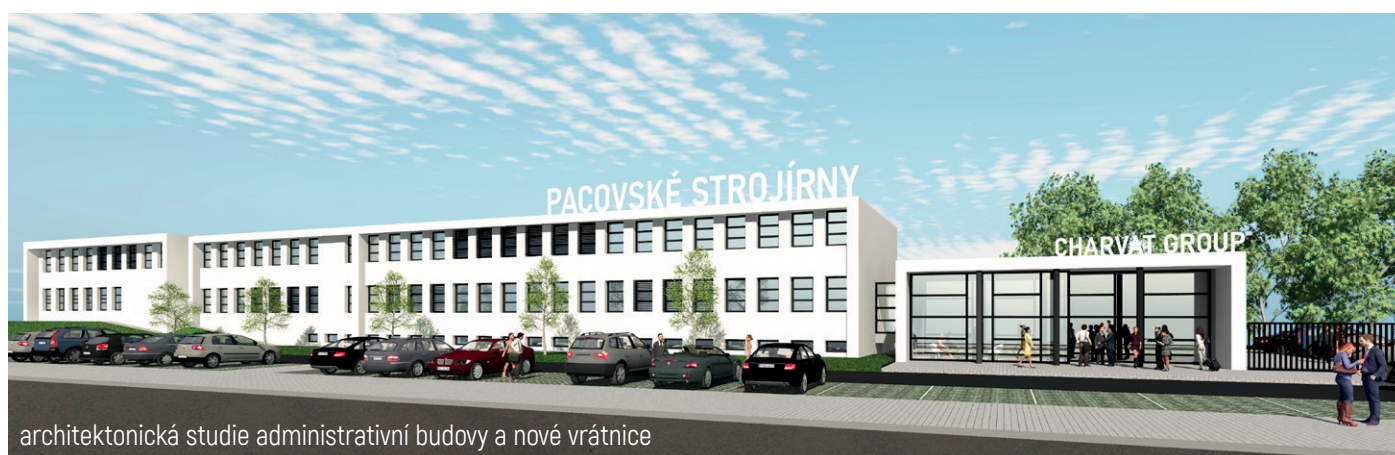
architektonická studie administrativní budovy a nové vřtnice

Pacovské strojírnny mají bohatou historii sahající až do roku 1876, kdy rodina Hradeckých založila mědikoveckou dílnu, jež byla jedním z prvních pilířů strojírenství v regionu. Postupem času se z malé dílny stala továrna. Od roku 1948 podnik dozorovala komunistická strana. Společnost se rozšířila i do dalších průmyslových odvětví, zejména potravinářského. V letech 1957 až 1963 byl na současné adrese postaven nový závod. V roce 1970 došlo ke sloučení s oborovým podnikem SPP Hradec Králové a oborovým podnikem Obal a následovala změna názvu na Strojbal. V roce 1978 proběhla modernizace pro rozběhnutí výroby chladících zařízení na mléko podle licence belgické firmy PACKO. Po roce 1989 se začal rozvíjet sektor pivovarů a minipivovarů. V roce 1991 byla založena akciová společnost Pacovské strojírnny Pacov. Od roku 2006 do 2013 byla společnost členem skupiny ČKD Group, poté součástí skupiny SAFICHEM GROUP. A od ledna 2024 je součástí CHARVÁT Group.