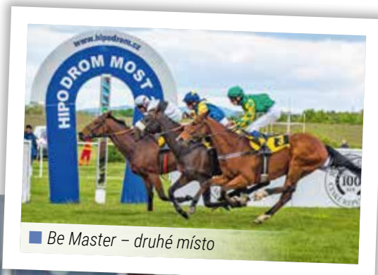
■ Be Master – druhé místo

Přinášíme přehled hlavních úspěchů našich koní. Na protější straně informujeme o průběhu I. kvalifikace na 129. Velkou Pardubickou a na poslední stranu Magazínu jsem umístili informaci o nadějném tříletém ryzákovi NIGHT TO MOON. A je samozřejmě třeba připomenout, že na svůj první dostih stále ještě čeká devět dvouletků, na jejichž výsledky je vypsána zaměstnanecská tipovací soutěž. Nu a nyní se podíváme na to, co se odehrálo letos na jaře v Mostě.