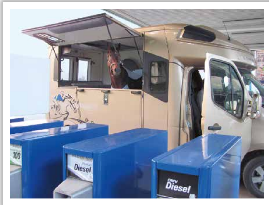
■ Přestávka na občerstvení