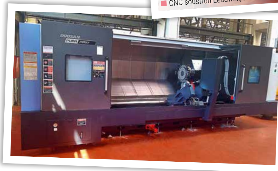
■ CNC soustruh DOOSAN PUMA, duben 2019

Pokud se týče prvního soustruhu, PUMY DOOSAN, tak ten již pracuje od poloviny května a vyrábí se na něm první dílce hydraulických válců pro firmu LIEBHERR. Druhý soustruh, NHP 5000, je již rovněž nainstalovaný,